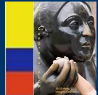
IV Congreso Lima 2008