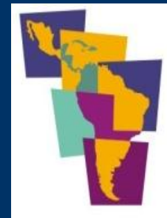
V Congreso Buenos Aires 2010