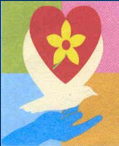
I Congreso Guadalajara 2000