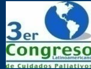
III Congreso Isla Margarita 2006