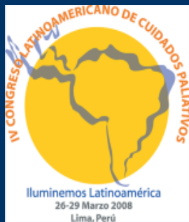
VII Congreso Medellín 2014